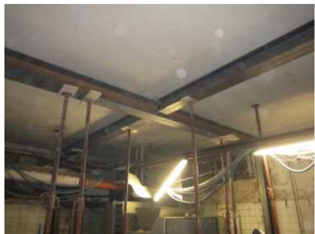
SOTTOMURAZIONE DI SOLAIO CON TRAVI AD INCASTRO