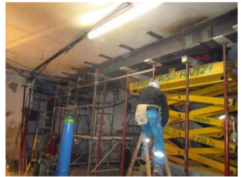
FASI DI MONTAGGIO TRAVI DI RINFORZO