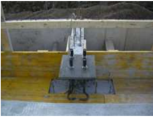
PREPARAZIONE PER IL GETTO DI TIRAFONDI