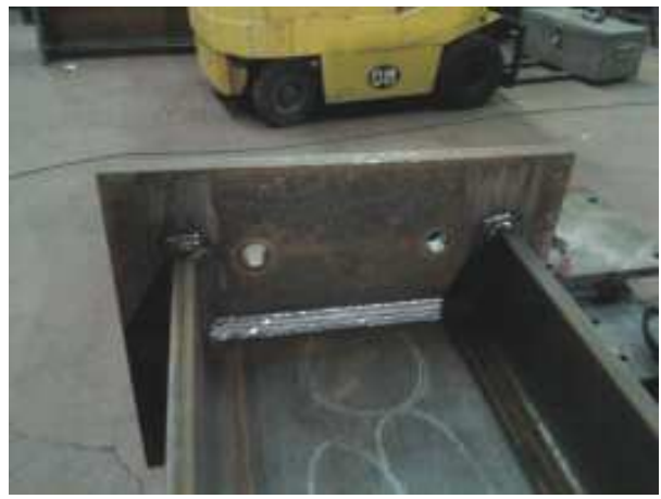
PARTICOLARE DI UNIONE SALDATA TRA PIASTRA E TRAVE