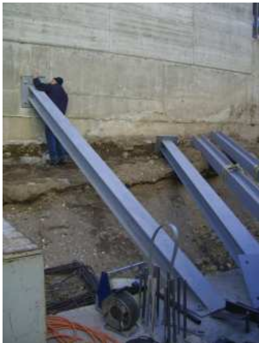
SOTTOMURAZIONE DI PARETI IN CALCESTRUZZO