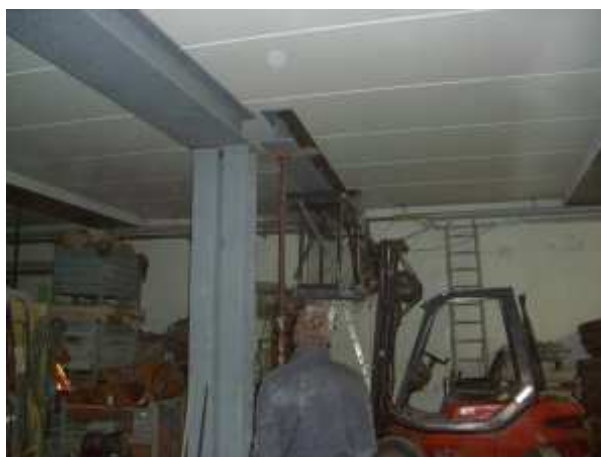
STRUTTURA IN ACCIAIO SALDATA FORMATA DA DOPPIE TRAVI HEB 340 MONTAGGIO AD INCASTRO SU STRUTTURA IN CEMENTO