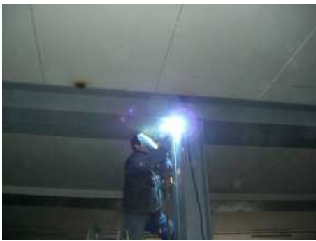
PARTICOLARI DELLE FASI DI SALDATURA